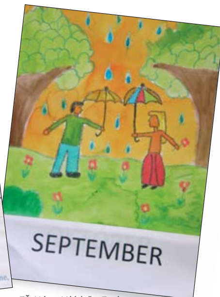
ZŠ, Nám. Mládeže, Zvolen