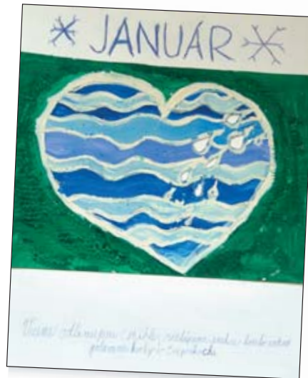
ZŠ, ulica Križku, Kremnica