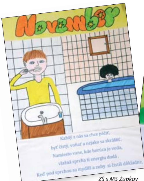
ZŠ s MS Župkov